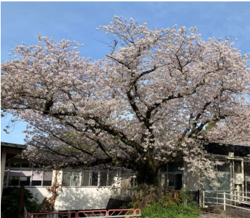
さつきユニットの外観