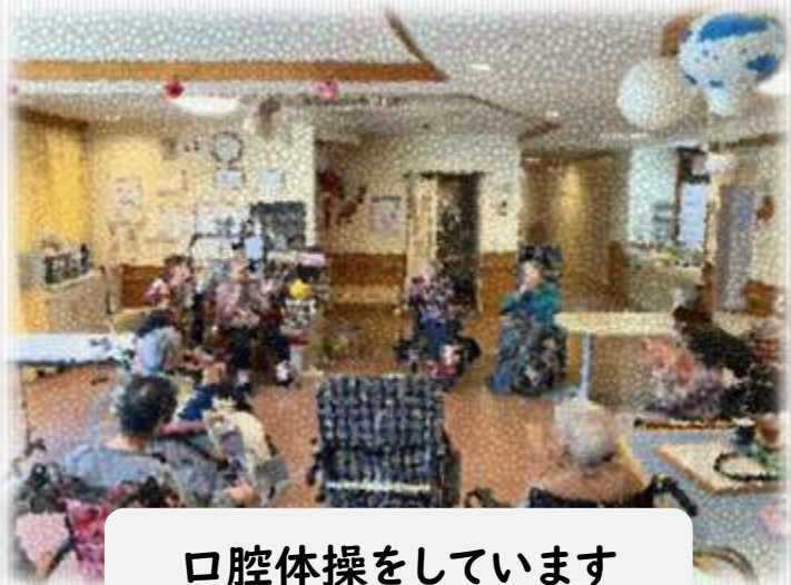
口腔体操をしています

利用者さん一人ひとりに専任の職員が付き、親身に向き合い、「笑顔があふれるより良い暮らし」充実した環境とサービスを提供します。あなたの「生きる」に寄り添います。