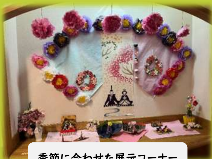
季節に合わせた展示コーナー

利用者が自由に動きながら生活できる環境、家庭的な雰囲気の中でキリスト教精神に基づき喜びと悲しみを共にし心温まる介護を提供します。地域の方をお祭りにご招待したり、参加させていただいたり地域との繋がりを大切にしています。