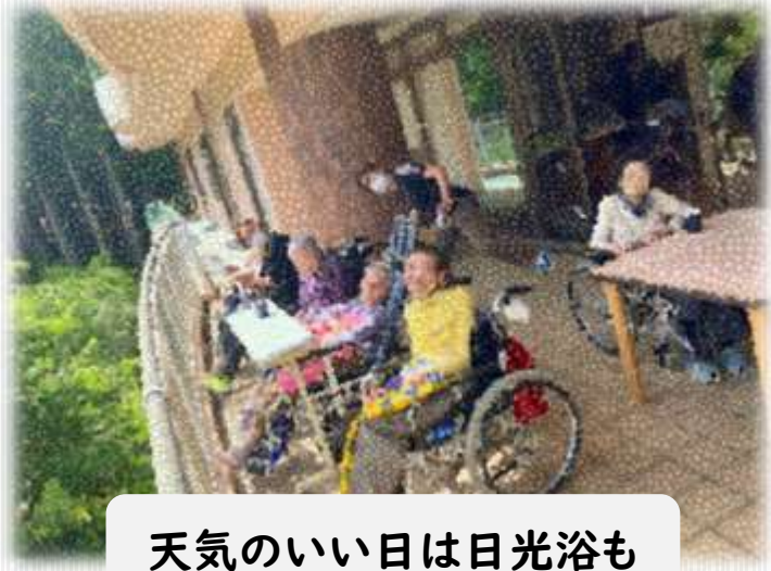
天気のいい日は日光浴も