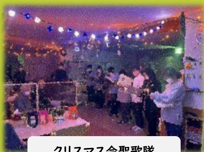
クリスマス会聖歌隊