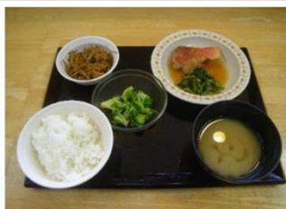
小切り・中切り食