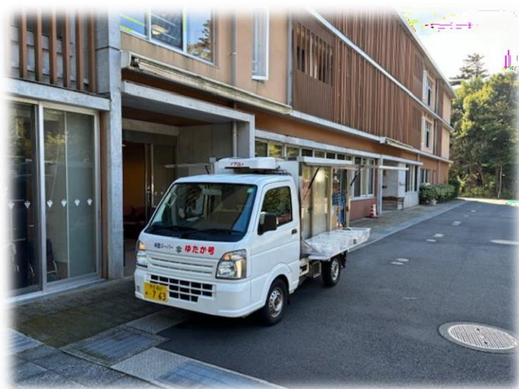
移動販売「ゆたか号」