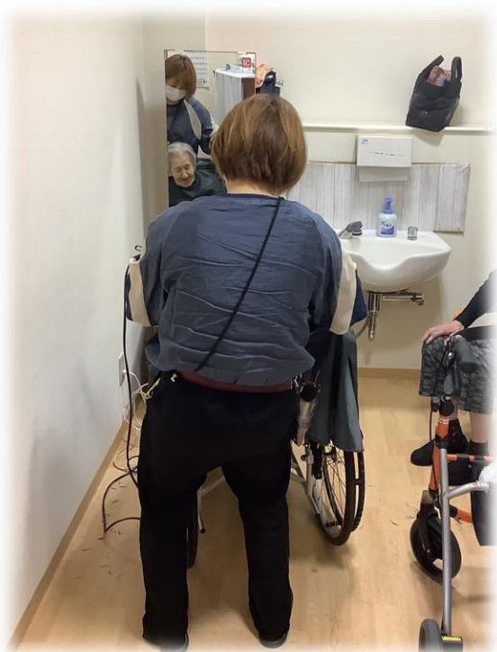
移動美容室「クランチケア」

移動美容室や移動販売、移動図書館などデイサービスに通いながら充実した生活のサービスが揃っています。